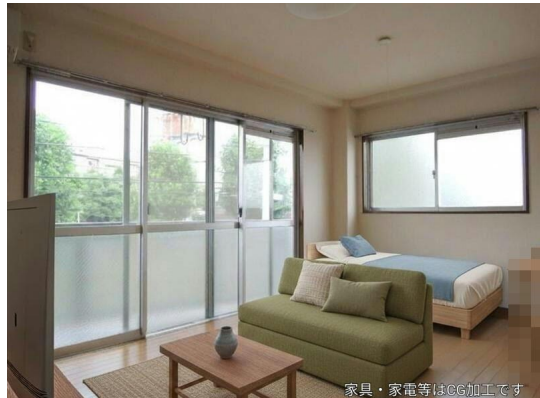
家具・家電等はCG加工です