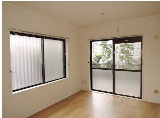
図面と現況が異なる場合は現況が優先となります。