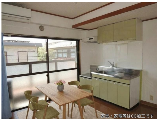
家具・家電等はCG加工です