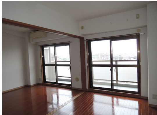
図面と現況が異なる場合は現況が優先となります。